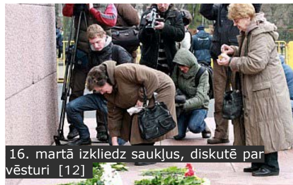
16. martā izkļiedz saukļus, diskutē par vēsturi [12]